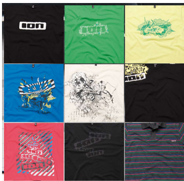
T-Shirt Designs 2010

ans Herz. Blättert diesen mal in Ruhe am Computer durch, denn schon allein das Layout macht wieder Lust auf die neue Saison. Mit den 2010er Ion-Essentials Produkten solltet Ihr dafür bestens gewappnet sein!