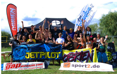
Die Campteilnehmer beim obligatorischen Gruppenfoto