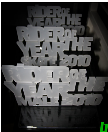
Die super stylischen Rider Of The Year 2010 Awards aus dem Hause UNIT Parktech