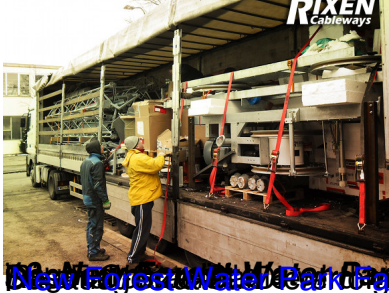
Next Forest Wakepark in England um Forwarding für die Sommerferien wurde die