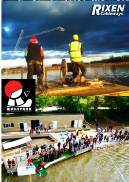
Facebook Seite von TND Wakepark für die Wakeboarding- und Wassersportbegeisterten im