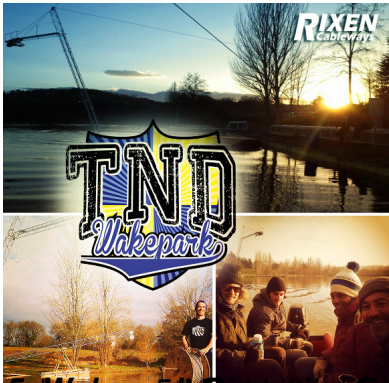
Seit Wakepark in TND eine stark kreisförmige Etablierung des Rixen-Systems in Weizener Bundesland hier geht

Geschrieben von: Benjamin Wiedenhofer Mittwoch, 29. Mai 2013 um 19:00 Uhr